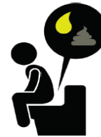
Orina oscura, heces blancas, y diarrea

Si tiene estos síntomas, consulte a su médico o visite la sala de emergencias más cercana.