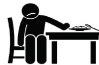
Pérdida de Apetito